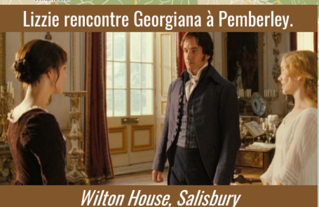
Lizzie rencontre Georgiana à Pemberley.