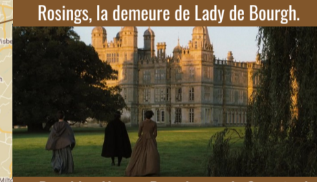
Rosings, la demeure de Lady de Bourgh.