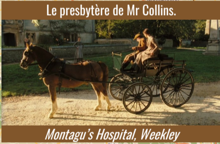
Le presbytère de Mr Collins.