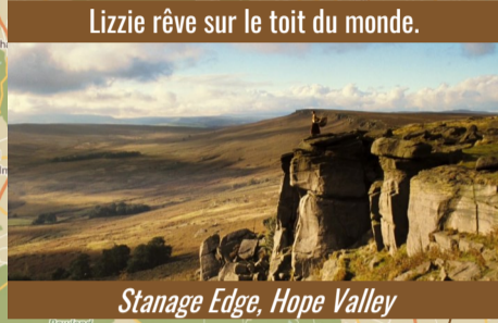
Lizzie rêve sur le toit du monde.