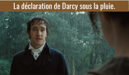
La déclaration de Darcy sous la pluie.