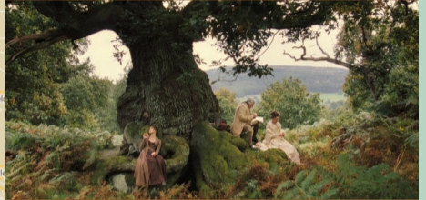
Forêt de Sherwood, Mansfield