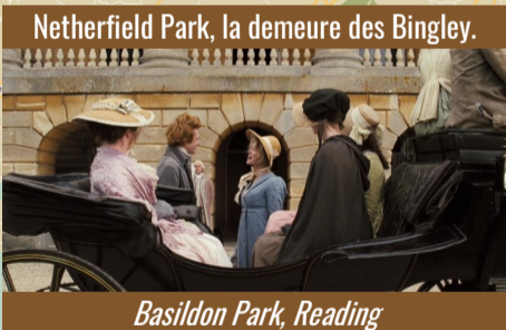
Netherfield Park, la demeure des Bingley.