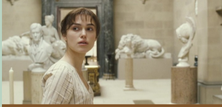
Chatsworth House, Bakewell