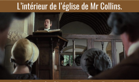
L'intérieur de l'église de Mr Collins.