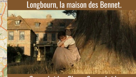
Longbourn, la maison des Bennet.